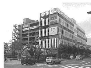
(トイゴパーキング)